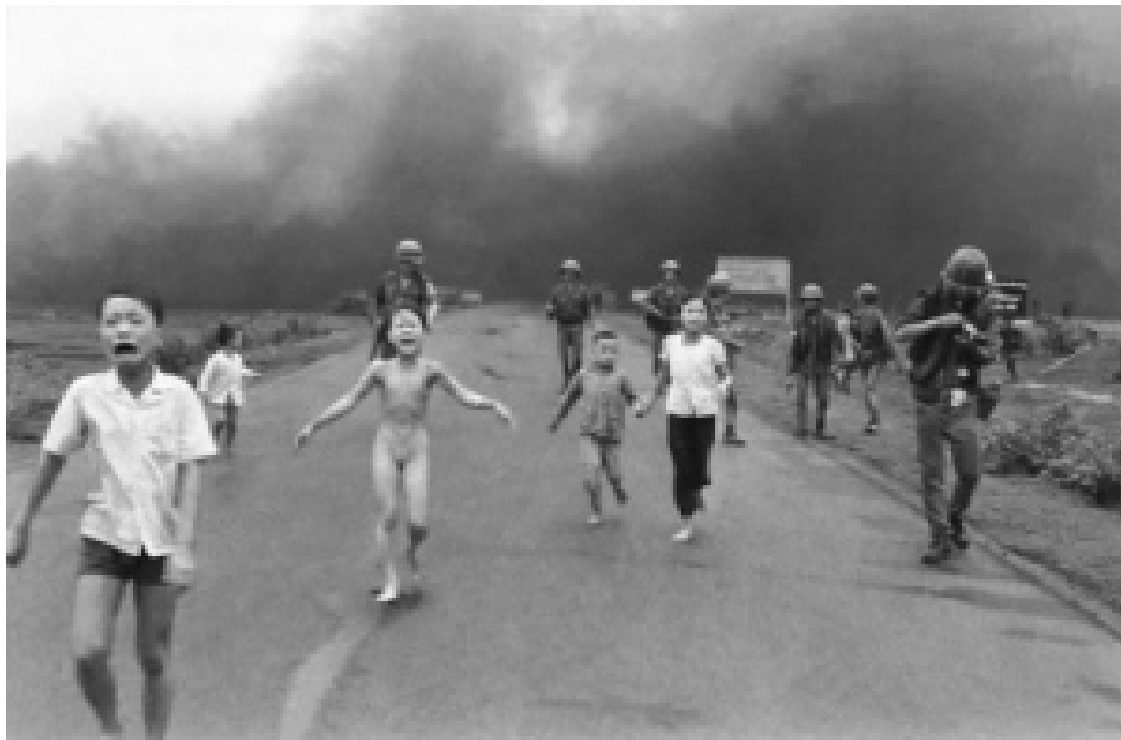
Πόλεμος στο Βιετνάμ - Η Phan Thi Kim Phuc μετά το βομβαρδισμό του χωριού της 8 Ιουνίου, 1972.