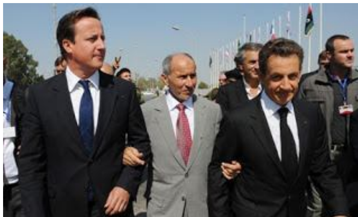
Στη φωτογραφία ο ηγέτης, επικεφαλής του Μεταβατικού Συμβουλίου, και οι Προστάτες του

Στην Τρίπολη βομβαρδίστηκε από το NATO το κτίριο διαφάνειας όπου φυλάσσονταν οι φάκελοι διαφθοράς υπουργών της κυβέρνησης 1