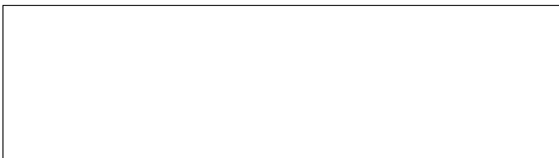
Πόλεμος στη Λιβύη – Βομβαρδισμός στην αποκλεισμένη Σύρτη σε Σχολεία, Νοσοκομεία, Σπίτια ..... (Φωτογραφία στο εξώφυλλο)

Παιδιά διαμελισμένα, κραυγές παιδιών θανάσιμα τραυματισμένων χωρίς παυσίπονα http://www.youtube.com/watch?feature=player_embedded&v=4R3sFvy1zGg